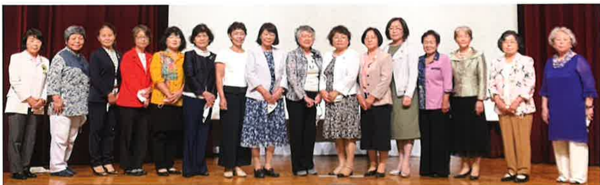
2021年度定時総会にて選任された役員(理事、監事)

今後とも、「女性の翼」発展のため鋭意努力する所存ですので、会員の皆様の益々のご協力を宜しくお願い致します。