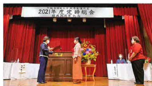
役員功労感謝状贈呈