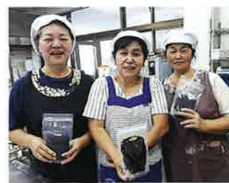
ちゅらさんグループ

私たち恩納村農産漁村生活研究会の「ちゅらさんグループ」は、恩納村の北部に位置した田園風景と恩納岳の見える安富祖地区でグループ活動を行っています。平成20年度に地域の農産物の加工品づくりグループとして6人で結成しました。主な活動は、地域の「農村婦人の家」を起点として、自家生産の米を原料とし味噌づくり、漬物、お菓子作りをグループ員が各々分担しています。活動目標は、「手作りを贈ろう! 創ろう! 食べよう! 恩納村の味」として、お中元やお歳暮、贈答品に地域産物の活用を推進しています。また、村の諸行事のイベント等に積極的に参加し農産物の販売を行っています。他の市町村の女性団体が資金造成に取り組みときには、グループ員が作った加工品を提供しています。 貴会の30周年記念式典において、私たちグループは、感謝状を頂きました。そこで受賞者代表挨拶ができたことは、私たちグループ員の誇りであり、大きな喜びであります。 本年、35周年記念を迎えられ、グループ員一同心からお祝い申し上げます。おめでとうございます。記念にグループ全員が賛助会員になりました。私たちグループは、賛助会員の一人として、これからも協力していきたいと思っております。